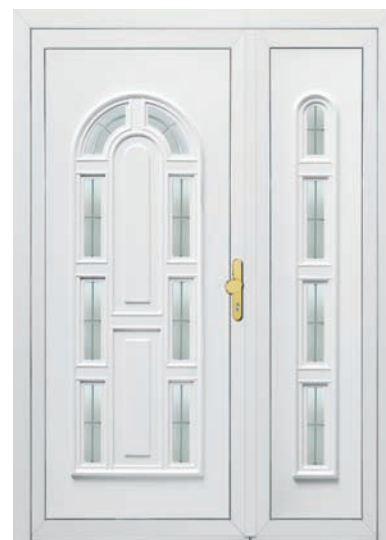
ROUEN pag. 33