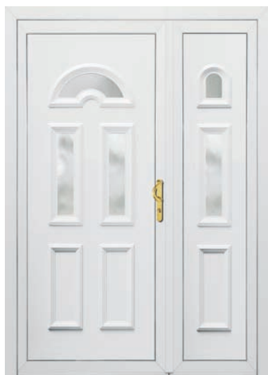
CALAIS pag. 31