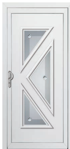
SI-DPB-3 Couleur: Blanc Poignée: LV-SR-T-s Code du vitrage: DPB