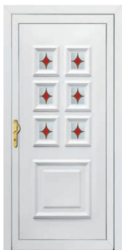
NANTES pag. 40