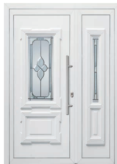
LYON pag. 36