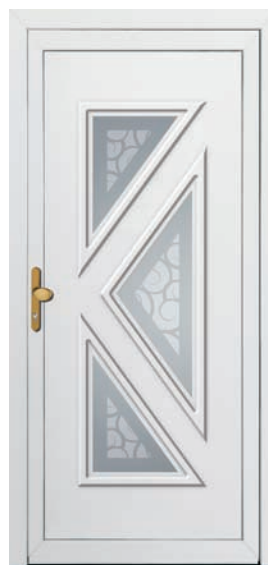
SI-DPO-3 Couleur: Blanc Poignée: LG-K-B-s Code du vitrage: DPO