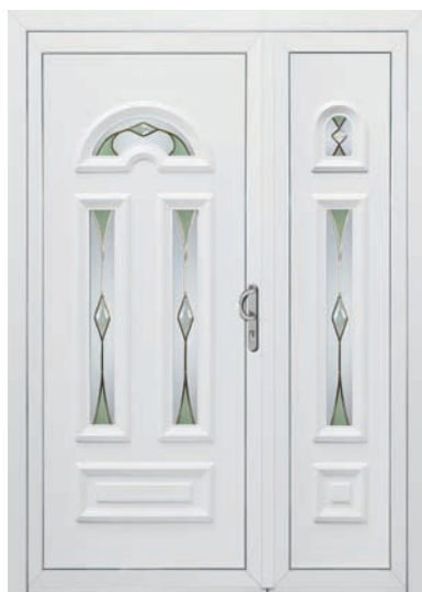
REIMS pag. 32