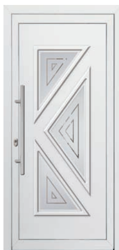
CHARTRES pag. 41