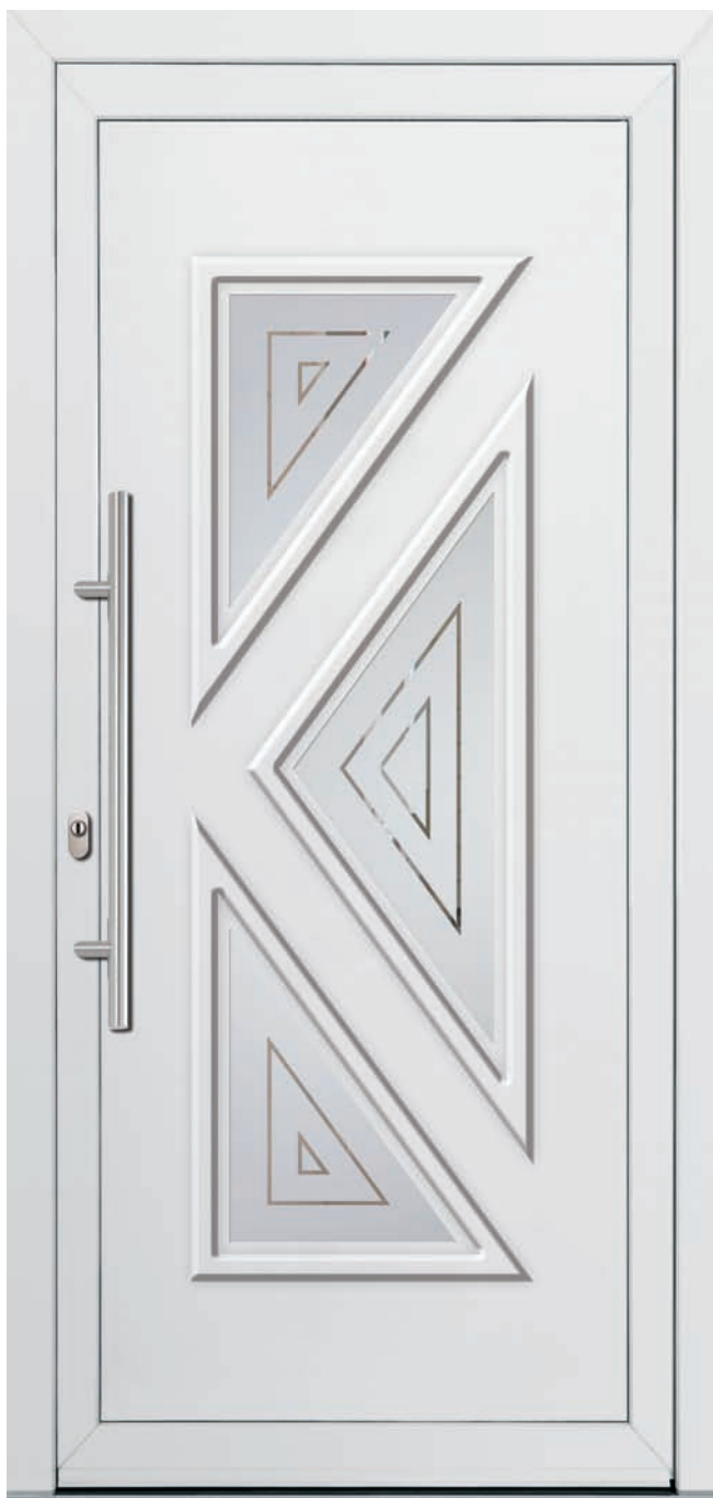
SI-PLF-3 Couleur: Blanc Poignée: D-800-I Code du vitrage: PLF