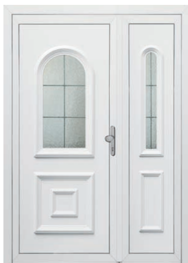
DIJON pag. 35