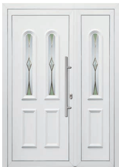
MANS pag. 34