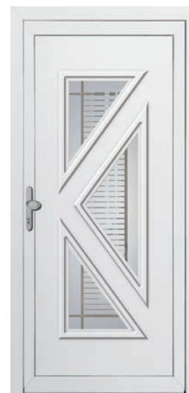
SI-PLT-3 Couleur: Blanc Poignée: LG-K-T-s Code du vitrage: PLT