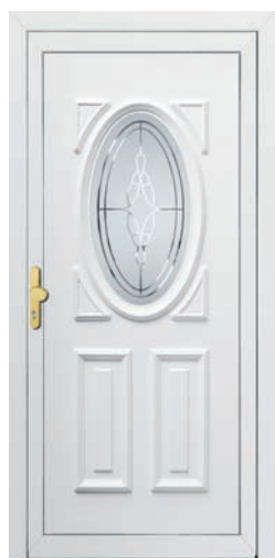
ORLEANS pag. 39