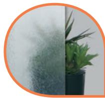
Chinchila clear CB