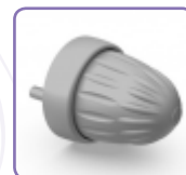
Bouton gris SL2161S155