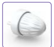
Bouton blanc SL2161S102