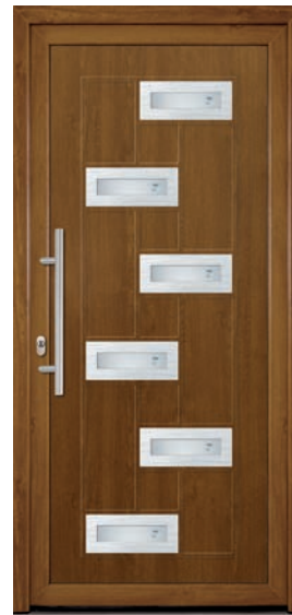
ZH-INX-ALE-FAB-6 Couleur: Chêne doré Poignée: D-600-I Décoration: acier Code du vitrage: FAB