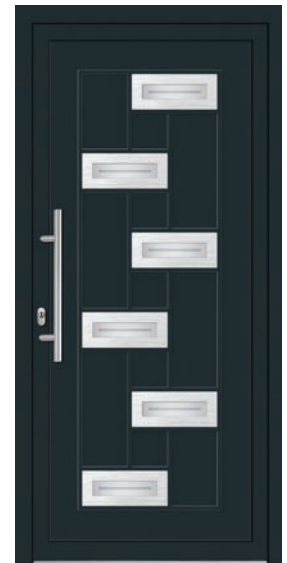
AG-INX-ALE-DPR-6 Couleur: Gris anthracite strié Poignée: D-600-I Décoration: acier Code du vitrage: DPR