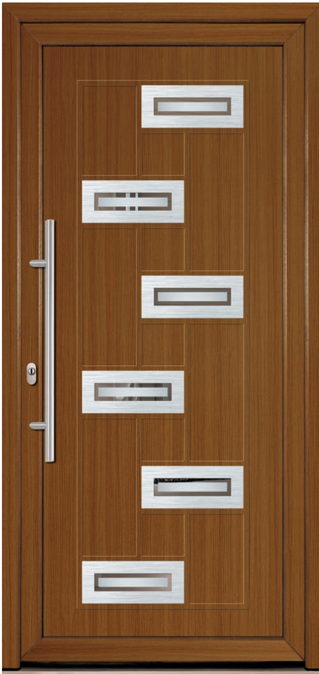
BO-INX-ALE-FPK-6 Couleur: Sapin douglas strié Poignée: D-800-I Décoration: acier Code du vitrage: FPK