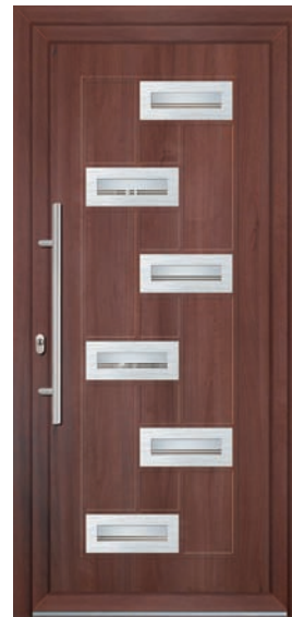
SR-INX-ALE-PFL-6 Couleur: Siena rosso Poignée: D-800-I Décoration: acier Code du vitrage: PFL