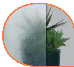
Chinchilla clear CB