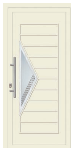
VIVIEN pag. 26