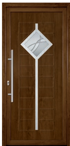
EVONNA pag. 20