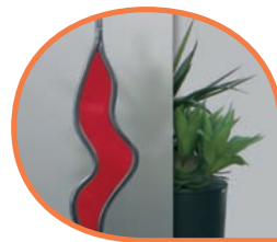
Vitrage satiné avec éléments colorés et inserts plomb. PTC/PTO