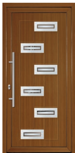
ALEGRA pag. 19