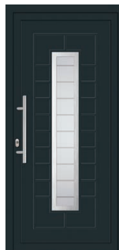
LEONA pag. 22