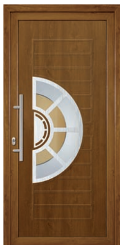
ZAIRA pag. 25