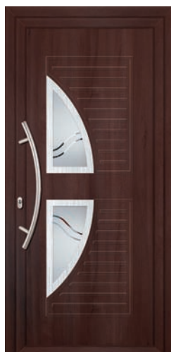
EWVA pag. 24