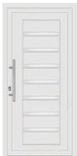
INNA pag. 23