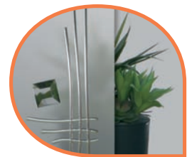
Vitrage satiné avec inserts plomb et facettes blanches. PTB*