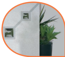
Vitrage satiné avec éléments sablés et facette collés. DPB