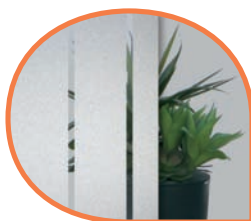
Vitrage avec éléments sablés DPC/DPH/FPK/PFL/SPL