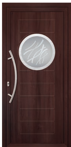
SELENA pag. 21