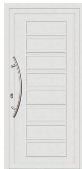
INN Couleur: Blanc Poignée: C-800-I