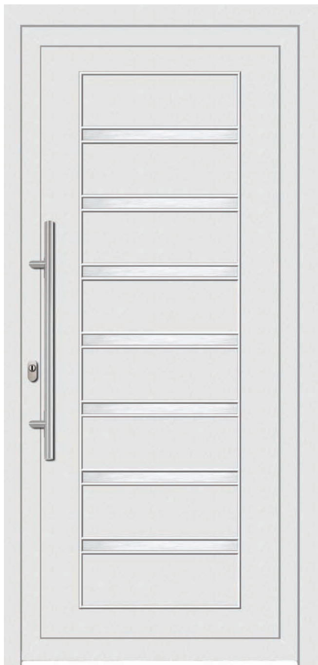
INX-INN Couleur: Blanc Poignée: D-800-I Décoration: acier