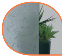
Vitrage MADRAS UADI