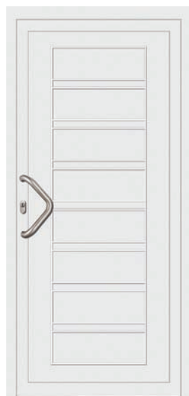
INN Couleur: Blanc Poignée: T-350-I