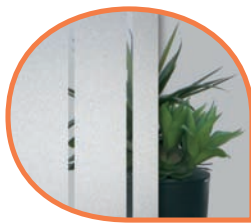
Vitrage avec éléments sablés DPC/DPH/FPK/PFL/SPL