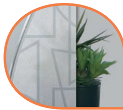
Vitrage satiné avec éléments sablés et inserts plomb. POT/TOK/SPT