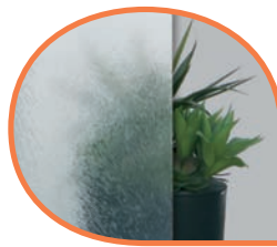
Chinchilla clear CB